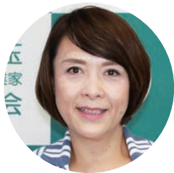
第21回 障害者問題全国交流会 from 埼玉